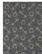
DENIM DARK BLUE