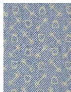
DENIM LIGHT BLUE