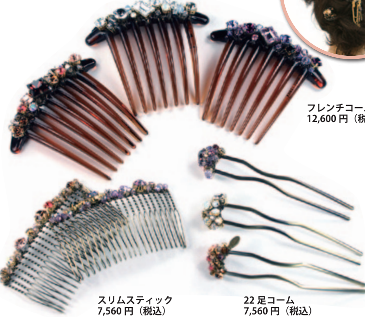
フレンチコム 12,600円(税込)

ビジュークラスタ エレガンスの極みともいえるシリーズ。 贅沢に使われたスワロフスキーが女性の ロマンティシズム表現しています。